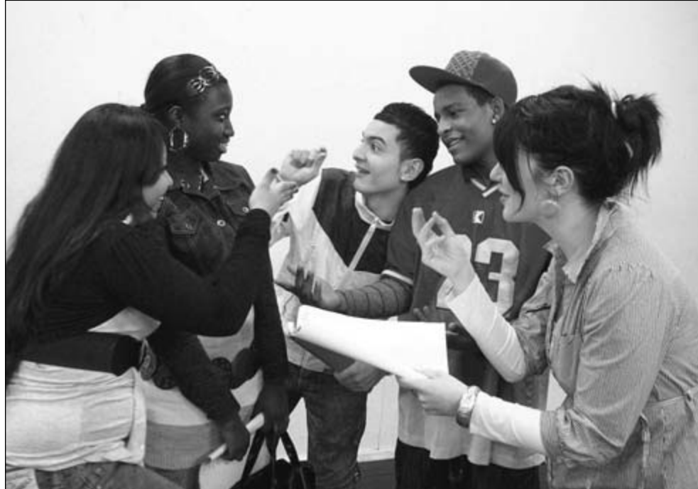
Jongeren afkomstig uit verschillende culturen, repeteren voor de voorstelling 'No Spang! Papa'. De voorstelling gaat over vluchten naar een ander land, cultuurverschillen, en opvoeding.

ARNHEM - Hoe is het om niet opgevoed te worden, omdat je in je eentje naar Nederland bent gevlucht? Hoe is het om je ouders achter te laten zonder afscheid te nemen? Hoe ga je om met de cultuurverschillen die er tussen thuis en de straat heersen? Arnhemse multiculturele jongeren vertellen in de theatervoorstelling 'No Spang! Pappa!' van Theatergroep Cactus' hun levensverhaal.